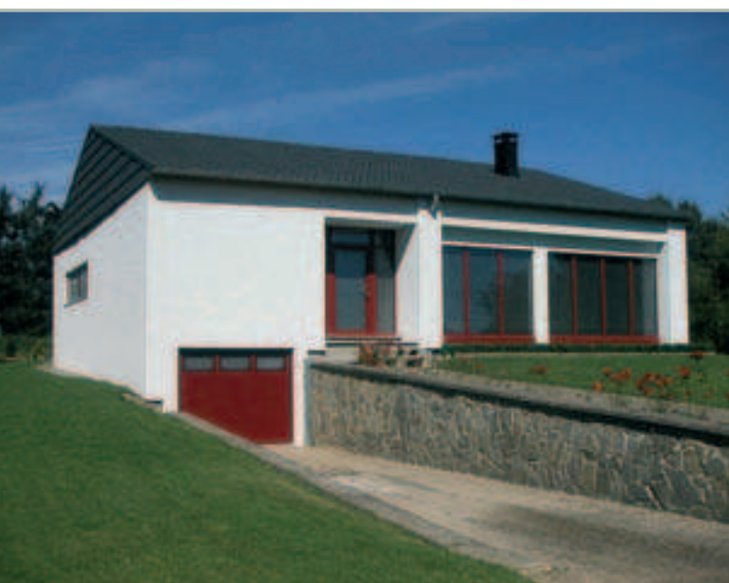
Rodinný dům po sanaci fasády systémem vinyTherm