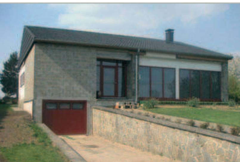
Rodinný dům před sanací fasády